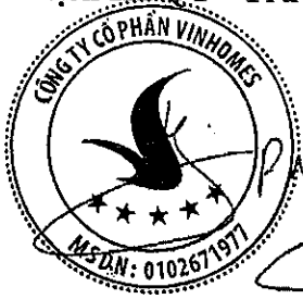
Phạm Nhật Vượng